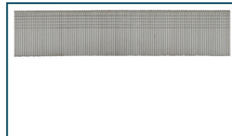
Brad 25mm 1,0x1,2mm (1 stuks) - F-31883 - 0088381292443