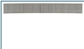
Brad 15mm 1,0x1,2mm (1 stuks) - F-31867 - 0088381292429