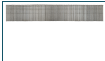
Brad 20mm 1,0x1,2mm (1 stuks) - F-31870 - 0088381292436