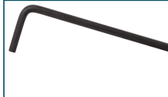
Inbussleutel 3,0 mm (1 stuks) - 783201-2 - 0088381101288